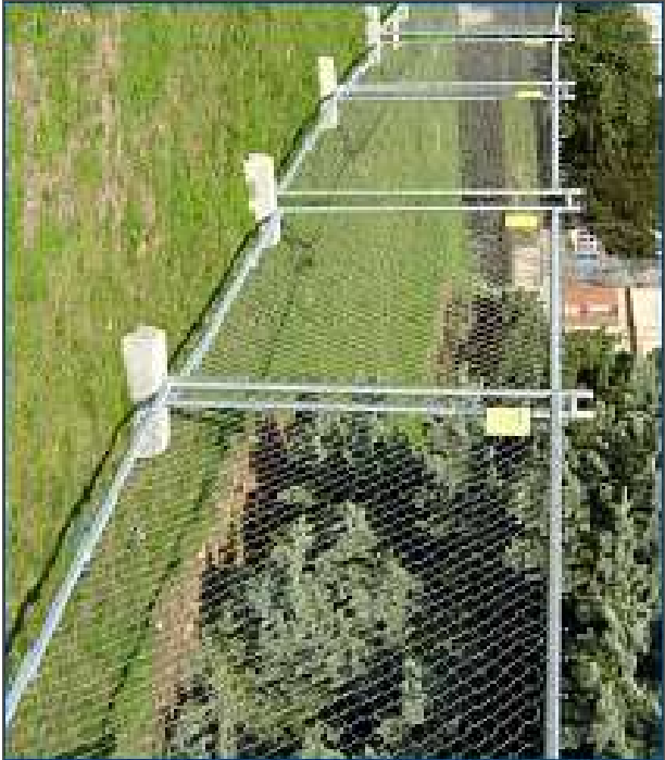
Obr 1.: Dočasné opätrenie

Ochrana proti zhrutneniu drevenou štiepkou hr. vrstvy 200 mm (21,11 m²)